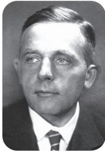
DR. OTTO WARBURG (1883-1970)

In de twintiger jaren van de vorige eeuw heeft arts, fysioloog en Nobelprijswinnaar Otto Warburg reeds de primaire oorzaak van onze welvaartsziekten, met name kanker , ontdekt. Volgens zijn onderzoeken is de primaire oorzaak van kanker een zuurstoftekort in de cellen van rond de 35%.